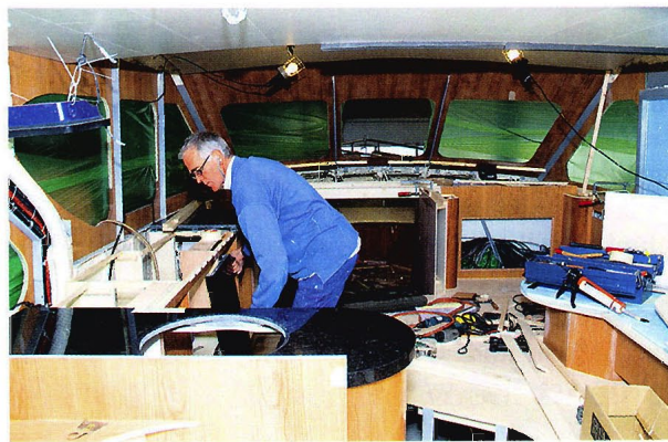
Beim Innenausbau werden Eignerwünsche umgesetzt