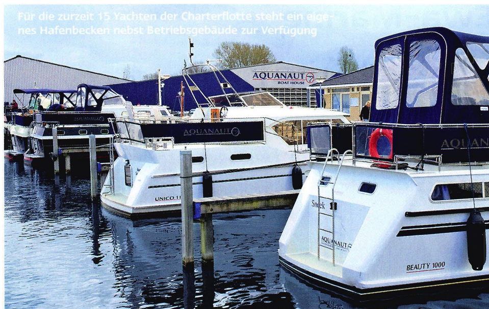
Für die zurzeit 15 Yachten der Charterflotte steht ein eigenes Hafenbecken nebst Betriebsgebäude zur Verfügung