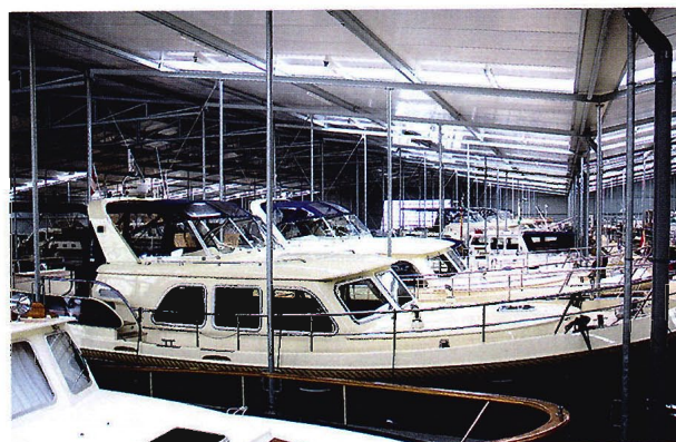
Gut behütet: Im Bootshaus stehen 71 Liegeplätze bereit