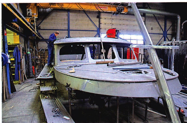
Modernste Technik wird gepaart mit solidem Handwerk

Rund 50 Mitarbeiter sind in den unterschiedlichen Geschäftsfeldern tätig. Bei den Aquanaut-Stahlyachten reicht die Fertigungstiefe von der hauseigenen Entwicklungsabteilung über den Kaskobau, das Sandstrahlen und Lackieren bis zum Möbel- und Innenausbau. Entwickelt wird zeitgemäß am Computer, die Entwürfe werden aus dem CAD-Programm an eine CNC-gesteuerte Plasmaschneidanlage gesendet, die die Stahlteile millimetergenau zuschneidet. Die ansprechenden Rundungen entstehen mittels einer CNC-Bie-