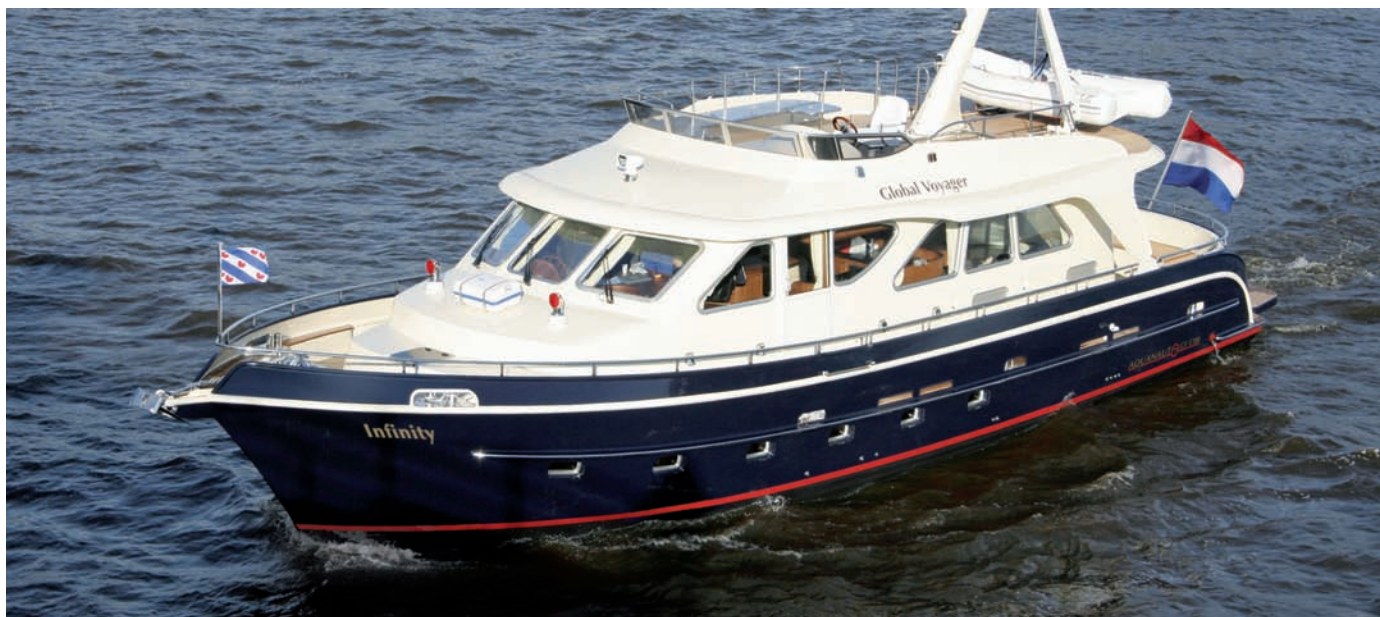
Macht nicht nur optisch etwas her, präsentiert sich darüber hinaus mit perfekten Fahreigenschaften, die Aquanaut Grand Voyager 1700.