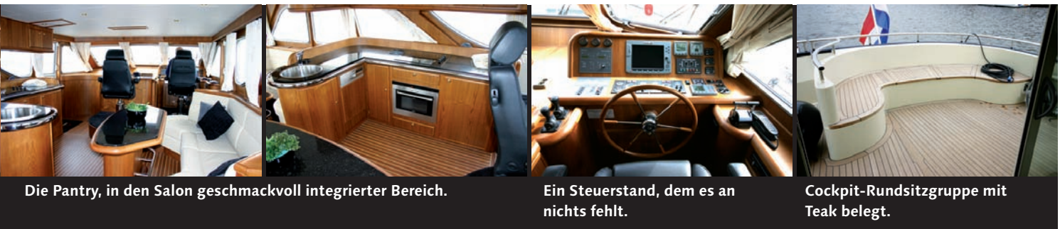
Die Pantry, in den Salon geschmackvoll integrierter Bereich.